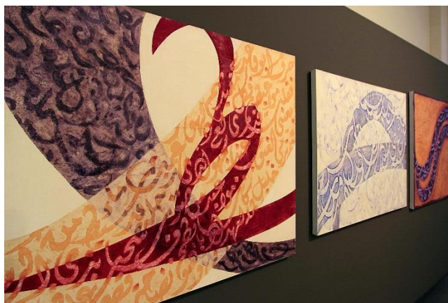
Imagen: Ziryab, de Rima Farah.

Casa Árabe quiere con este acto celebrar la universalidad de la lengua árabe y su pervivencia en la lengua española a través de multitud de palabras provenientes del árabe que se mantiene en uso. Este acto clausura el décimo aniversario de Casa Árabe tras un año en el que se han organizado más de una veintena de actividades especiales entre seminarios, conferencias y conciertos.