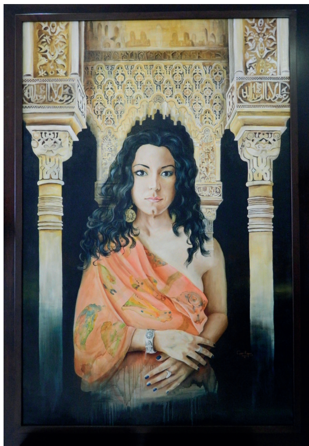
Morayma. Obra cedida por la artista Carmen López Rey.

El recorrido parte de Casa Árabe, visitando sucesivamente el Centro Cultural Rey Heredia (Antiguo Convento de Santa Clara), la calle Alfayatas, la puerta del Sabat, los Baños Califales y finalizando junto a la Estatua de los Amantes en el Campo Santo de los Mártires.