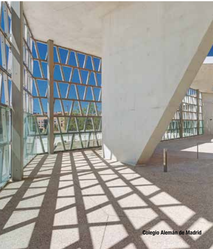
Colegio Alemán de Madrid