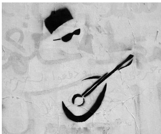
Graffiti aparecido en las calles de El Cairo con imagen del popular músico egipcio Sheikh Imam

La brecha generacional en los países árabes se hizo patente durante los levantamientos de 2011. Las expresiones culturales de los jóvenes en las calles, de Túnez a Sanaa pasando por Manama, hicieron de la creatividad una virtud política para avanzar en la libertad de expresión y otras libertades individuales. Los grafitis, el teatro callejero, los eslóganes y las nuevas composiciones de trovadores urbanos demostraban en 2011 un dinamismo que sorprendió no solo a sus padres, sino a ellos mismos. A seis años de la eclosión en la plaza Tahrir, conviene hacer un repaso y una reflexión sobre el legado, la innovación y la representación las de las culturas árabes.