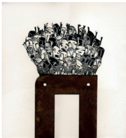
1. La isla

En este contexto y mediante la técnica de la xilografía, he intentado retomar el carácter documental de la estampación para abordar esta realidad social de las fronteras y los problemas migratorios. Así, inspirado en la frase de uno de los personajes de la novela de Manuel Rivas El lápiz del carpintero : «Lo único bueno que tienen las fronteras son los pasos clandestinos», quiero mostrar cómo las personas están dispuestas a todo para sobrevivir, ya que, al fin y al cabo, la vida es más vida «al otro lado».