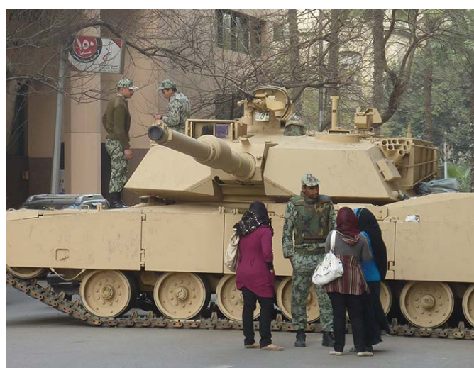
Imagen: Karim Hauser