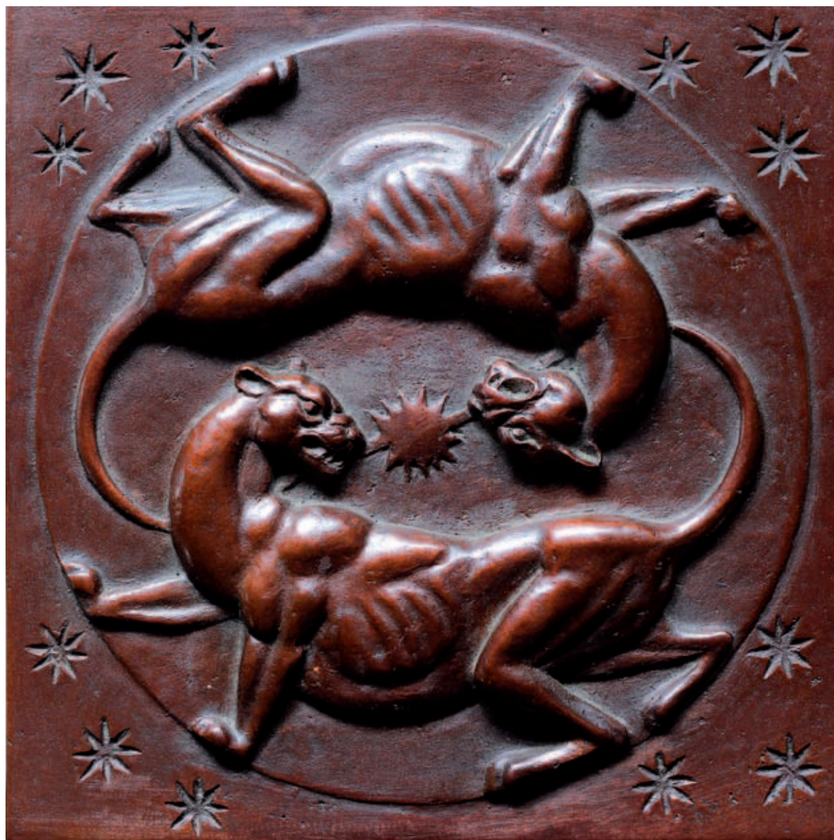
EL MOMENTO PRESENTE Bronce a la cera perdida, ed. de 6 17 x 17 cm