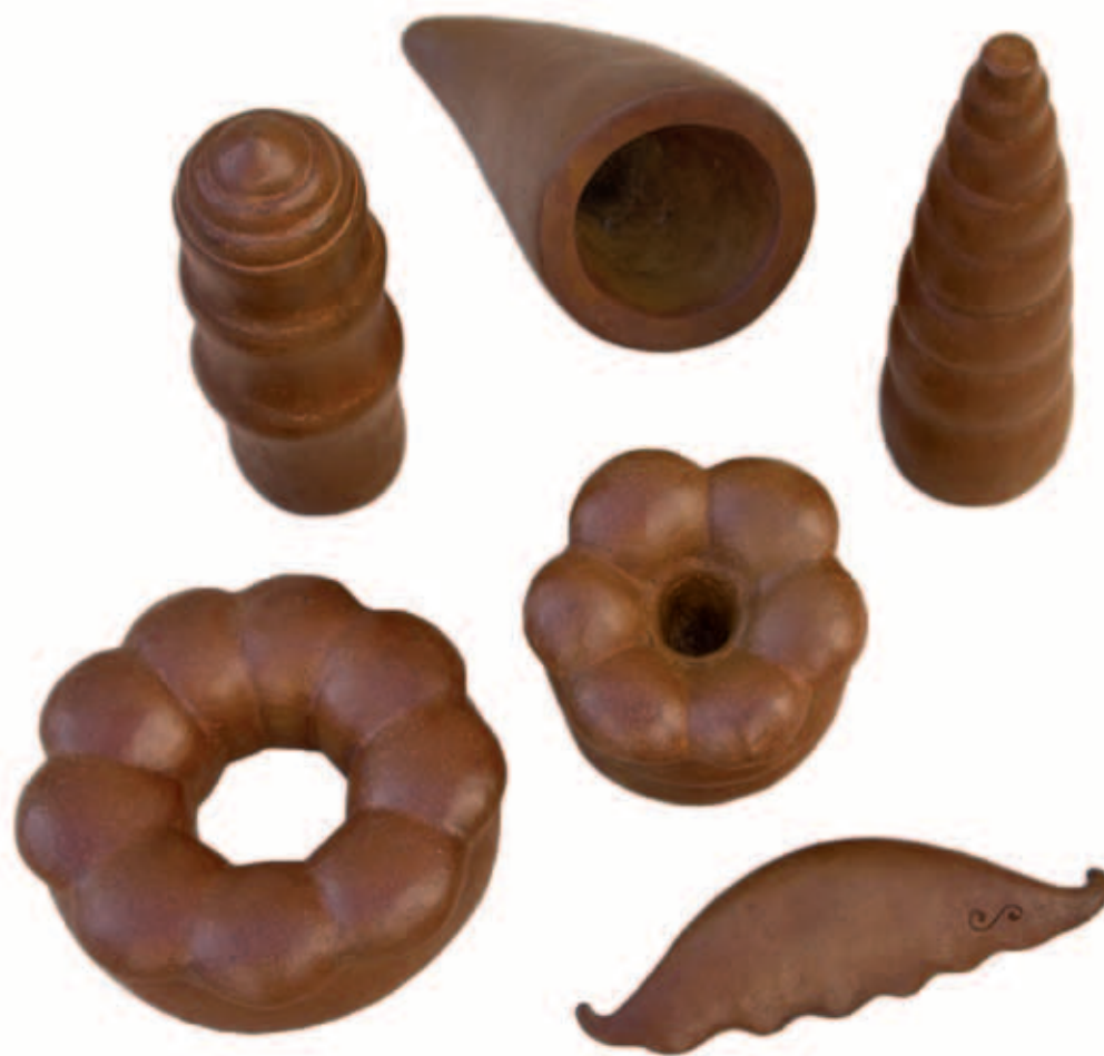
FORMAS GEN Bonce a la cera perdida, ed. de 6 c/u Medidas varias