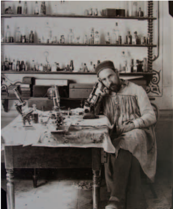
Don Santiago Ramón y Cajal, a quien debo la inspiración y el título de esta exposición.