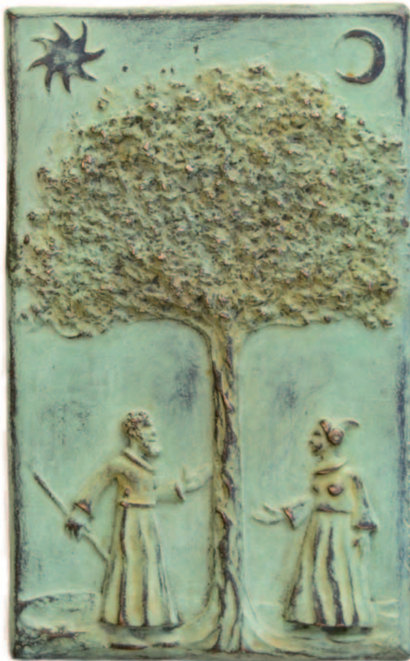
EL ÁRBOL DEL CONOCIMIENTO Bronce a la cera perdida, ed. de 6 19 x 12 cm