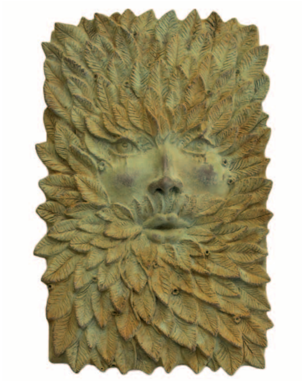
THE GREEN MAN Bronze a la cera perdida, ed. de 6 19 x 12 cm