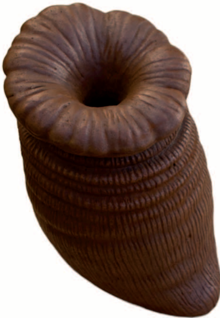
FORMA GEN Bronce a la cera perdida, ed. de 6 22 x 13 cm