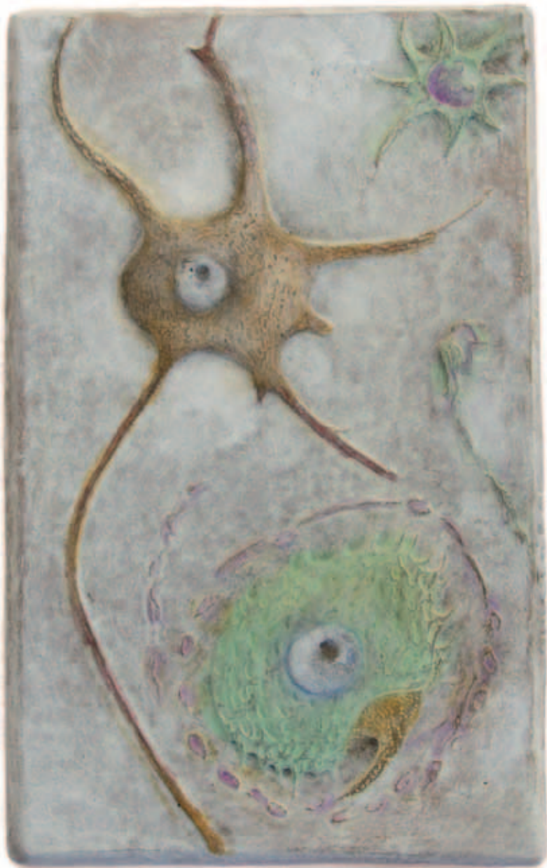
SINAPSIS 1 Bronce a la cera perdida, ed. de 6 19 x 12 cm