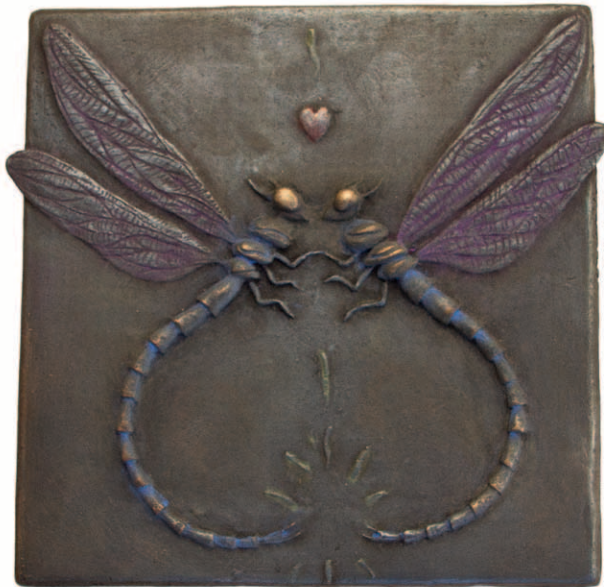
LIBÉLULAS ENAMORADAS Bronce a la cera perdida, ed. de 6 17 x 17 cm