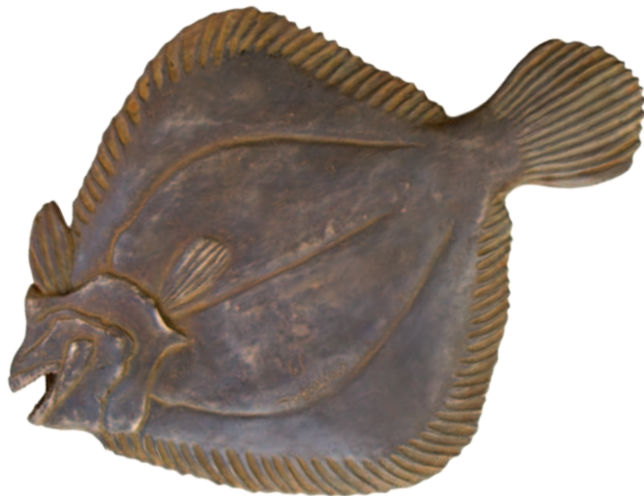
RODABALLO Bronce a la cera perdida, ed. de 9 45 x 26 cm