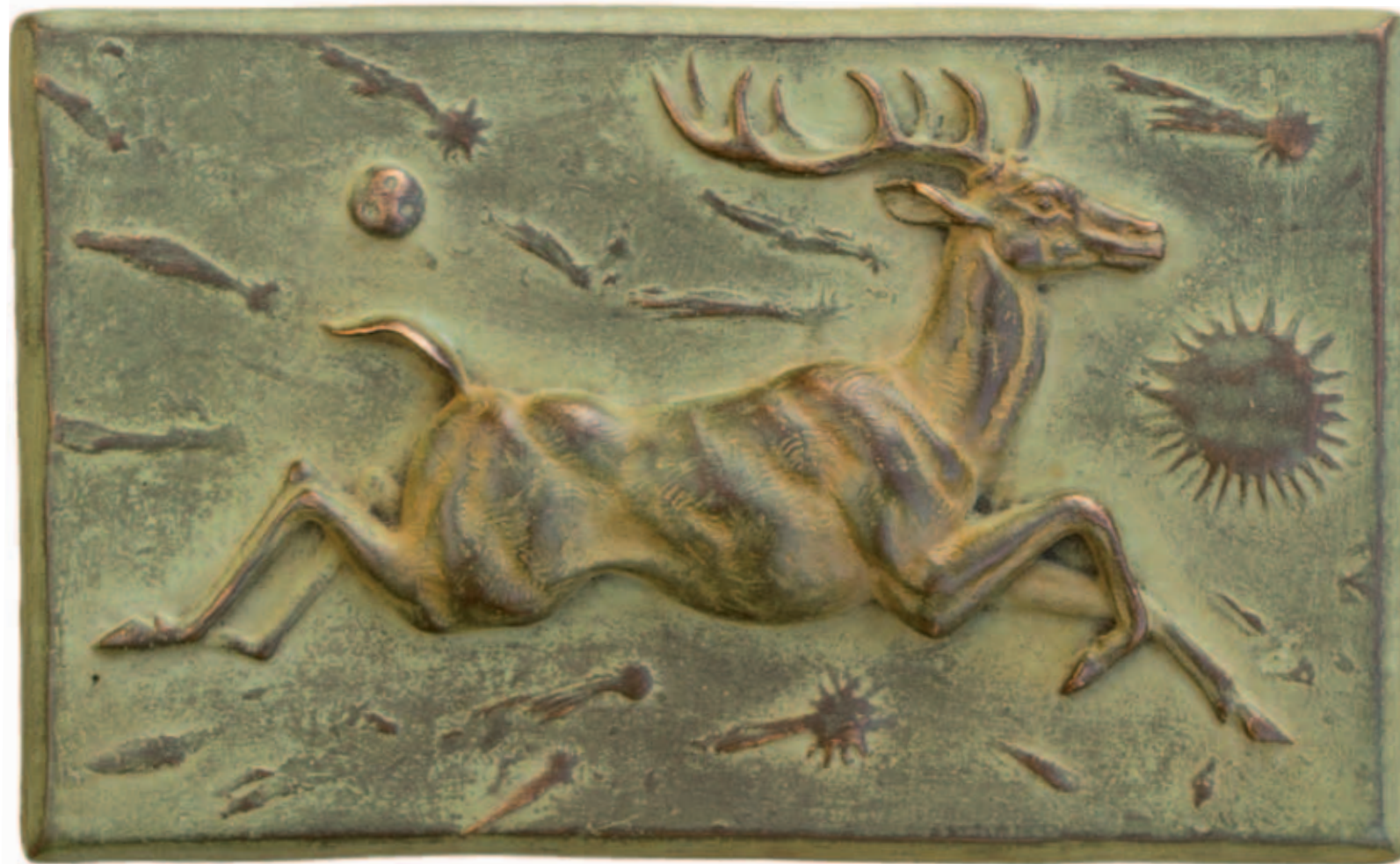
EL PRESENTE FUGITIVO Bronce a la cera perdida, ed. de 6 19 x 12 cm