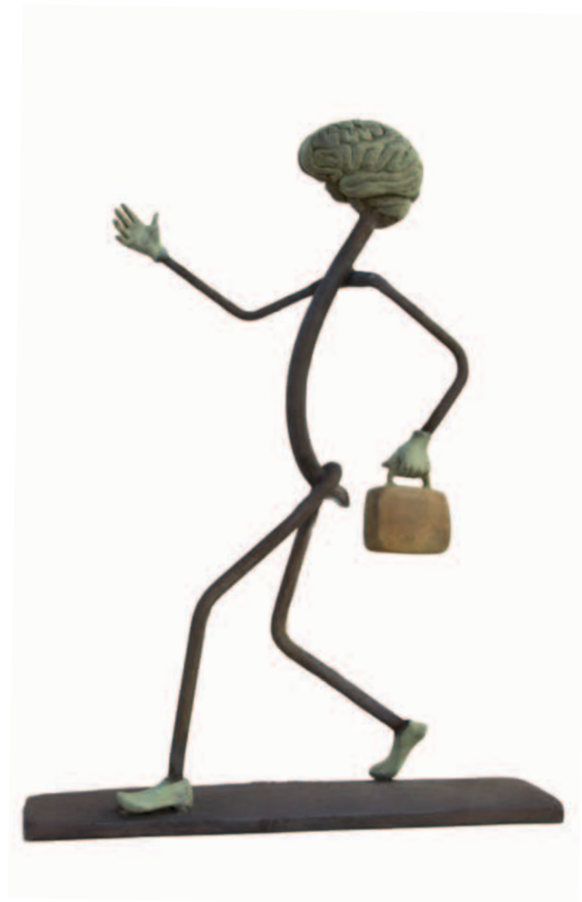
CEREBRO ANDANTE Bronce a la cera perdida, ed. de 9 23 x 21 cm

Del 2005 al 2008, realiza el estudio y la ejecución del Proyecto de 14 Relieves para los Parques Nacionales de España. Instalados en el Centro de Visitantes de Cabrera, en Colonia San Jordi, Mallorca.