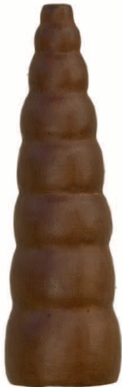
FORMA GEN Bronze a la cera perdida, ed. de 6 12 x 3 cm