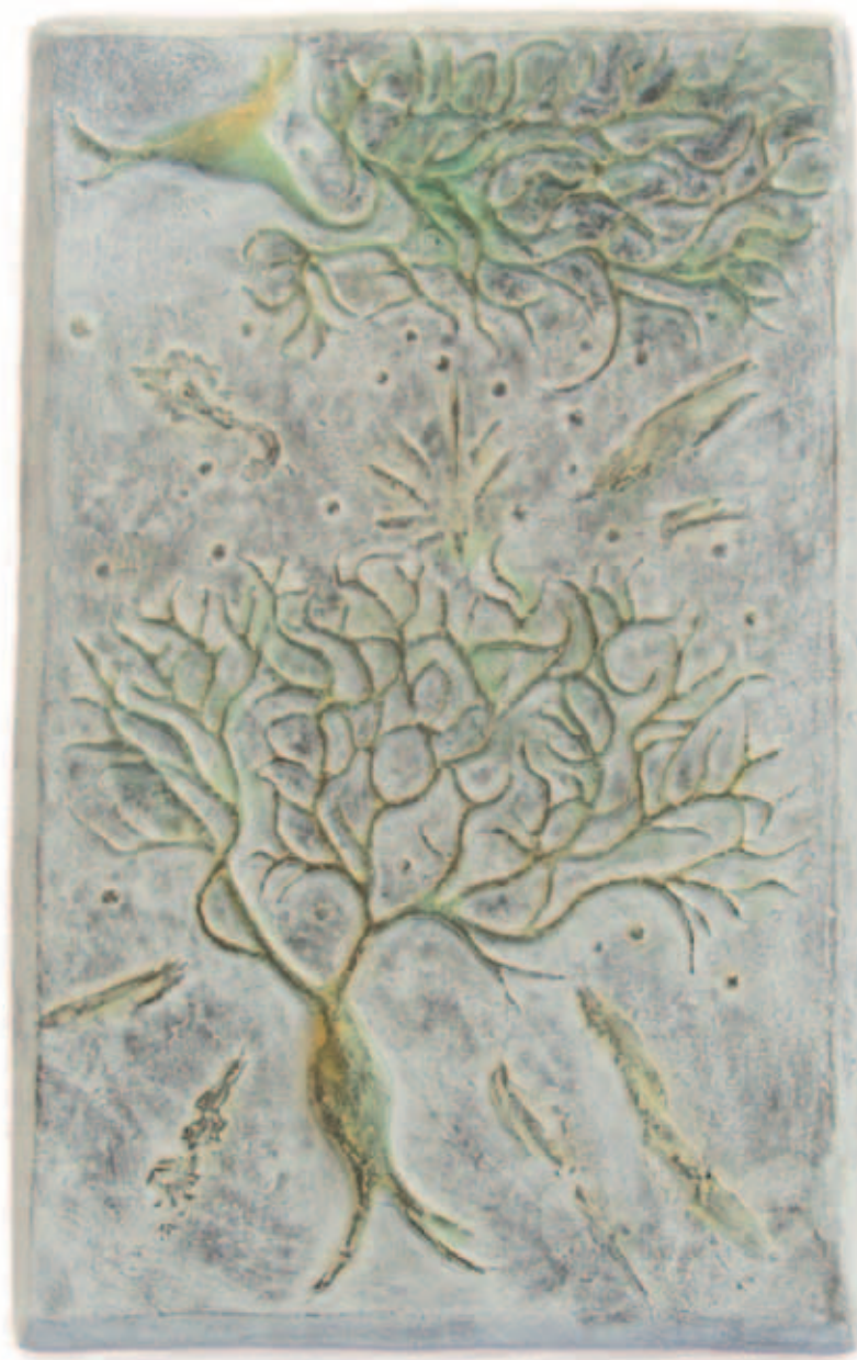
SINAPSIS 2 Bronce a la cera perdida, ed. de 6 19 x 12 cm